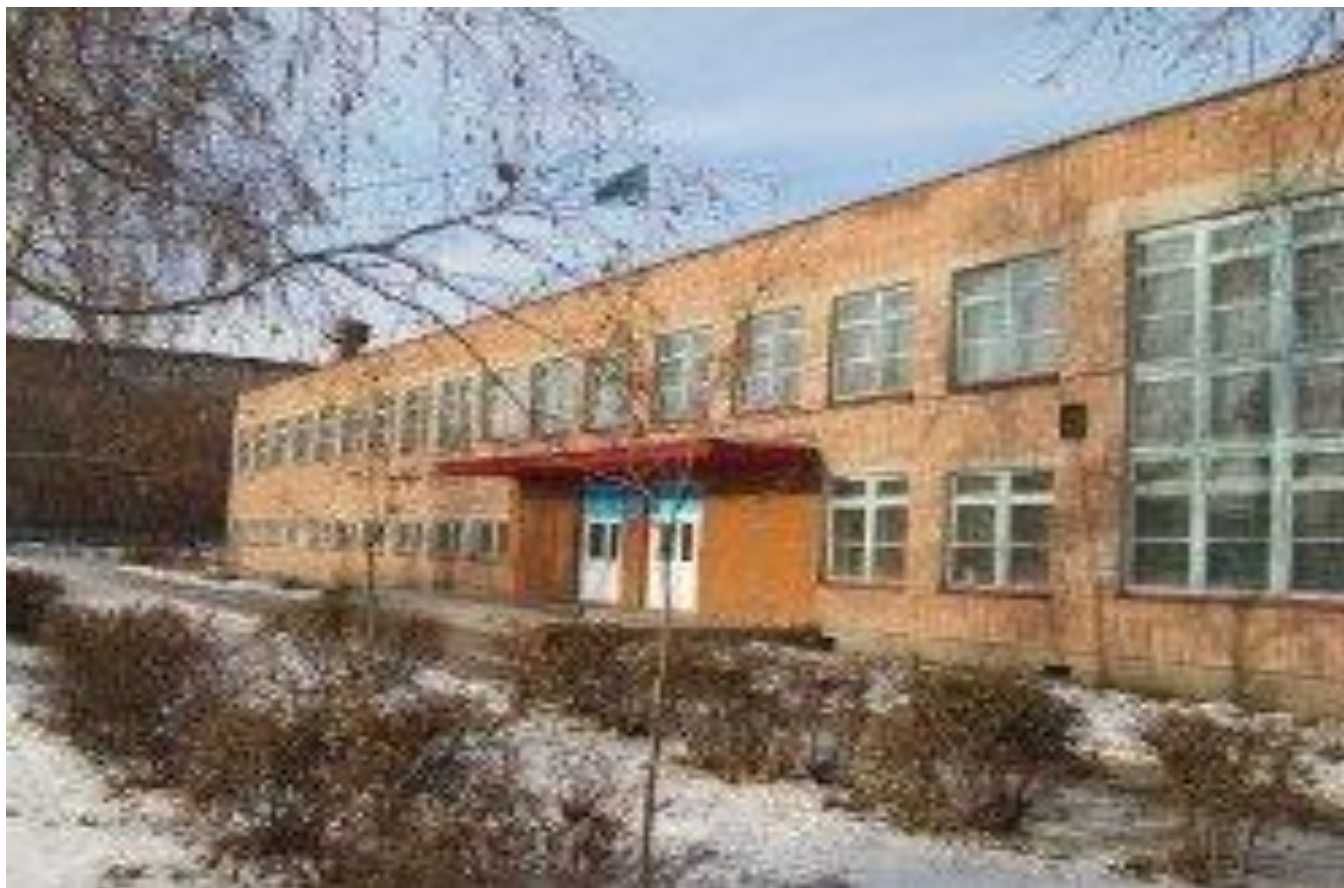
Өскемен қаласы әкімігінің “№37 орта мектебі” КММ