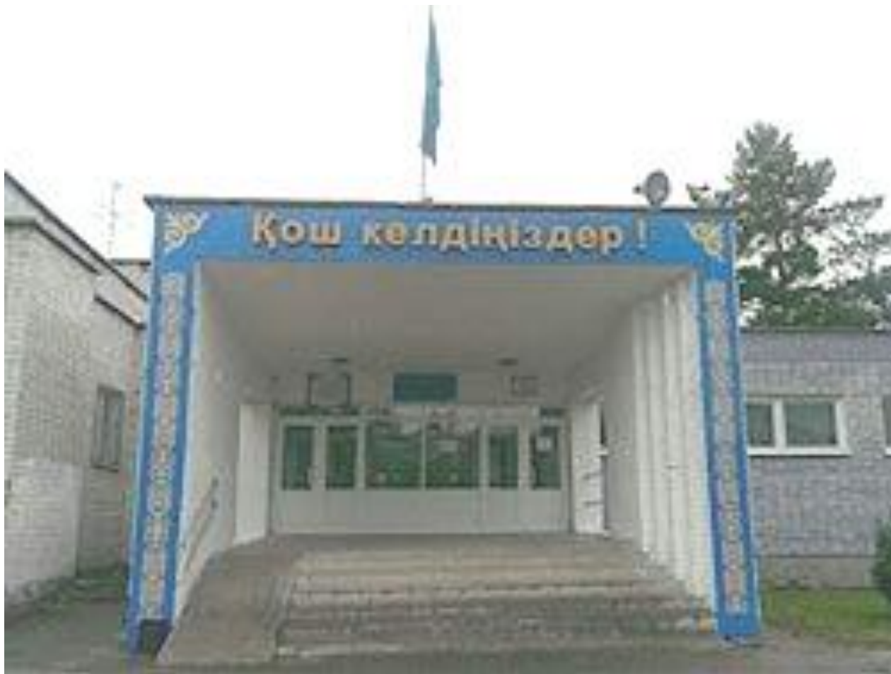
Өскемен қаласы әкімінің “№16 орта мектебі” КММ