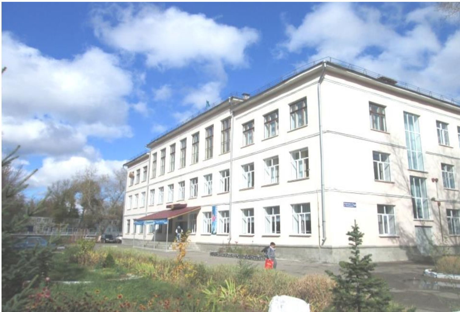
Өскемен қаласы әкімінің “№20 орта мектебі” КММ