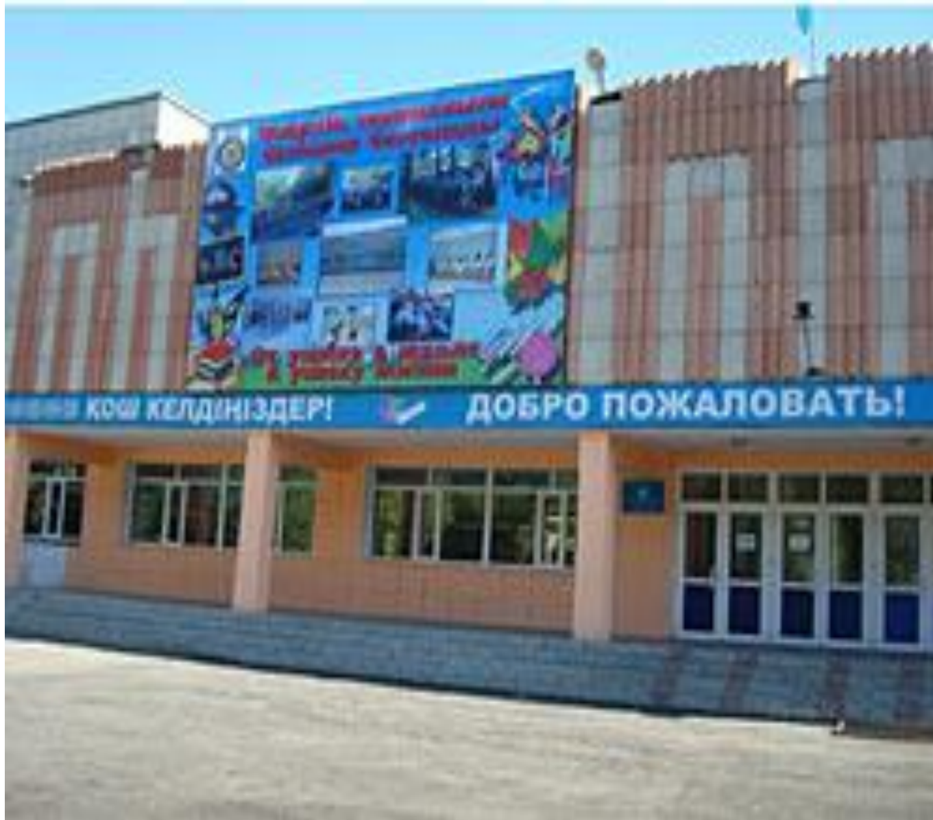
Өскемен қаласы әкімігінің “№16 орта мектебі” КММ