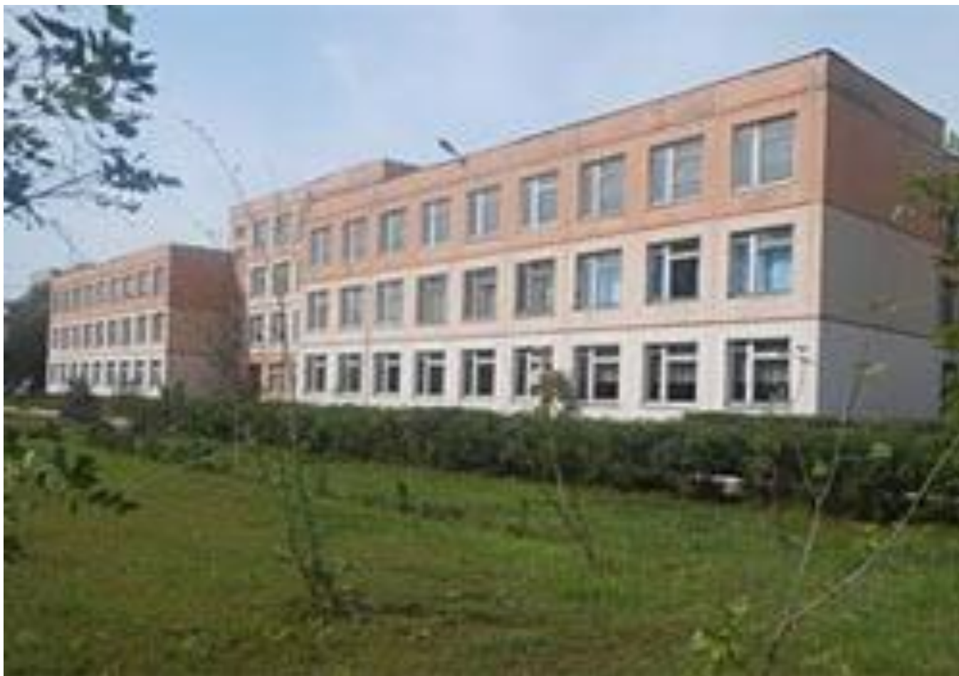
Өскемен қаласы әкімінің “№27 орта мектебі” КММ